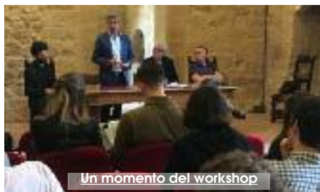
Un momento del workshop

Da Torino a Salemi per mettere a fuoco strategie e proposte progettuali utili al recupero e alla valorizzazione del centro storico della città. L'esperienza che stanno vivendo 15 studenti del dipartimento di Architettura e design del Politecnico di Torino, protagonisti del workshop «Architettura Salemi Entanglement» che li ha portati in Sicilia per conoscere il territorio e trovare soluzioni valide per rivitalizzare il centro storico di Salemi. Gli studenti sono arrivati nell'ambito della «Biennale Internazionale Arte Contemporanea Sacra di Sicilia» 2018 e alterneranno sessioni di studio in aula con le visite del territorio, elaborando una proposta per il recupero del nucleo antico di Salemi che proceda sia in un'ottica abitativa che in funzione di un possibile riutilizzo turistico, culturale e artistico di molti luoghi. «A cinquant'anni dal terremoto del 1968 - ha detto il sindaco Domenico Venuti -, abbiamo scelto di guardare avanti e ridare vita al centro storico aprendo la città agli studenti e alle idee che possono nascere da questa sperimentazione». (G.L.)